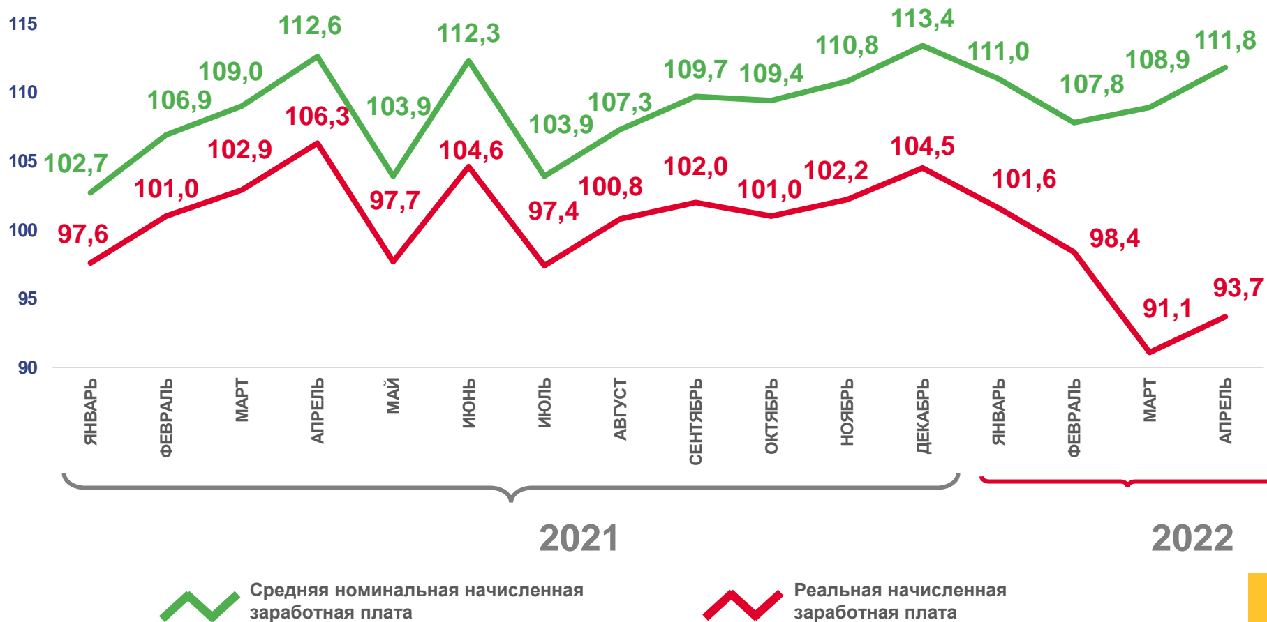
в % к соответствующему месяцу предыдущего года